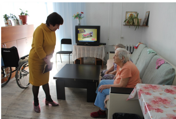
Проверка частного пансионата для пожилых людей, Ленинск-Кузнецкий район, 2019 г.

После проведения проверки уполномоченный Кузбасса занялся пристальным изучением соблюдения прав человека, постоянно проживающих в частных пансионатах. Был запланирован ряд выездных мероприятий.