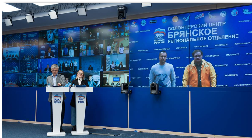
Социальный онлайн-форум "Единой России", 2021 г.

эпидемиологическим требованиям, это материально-техническое обеспечение для каждого конкретного учреждения, это штатное расписание, штатная численность