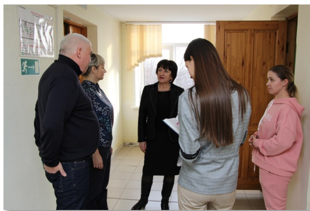
Посещение пансионата "До 100 лет", 2019 г.

13 ноября 2019 года уполномоченный посетил пансионат «До 100 лет», находящийся в городе Кемерово. Омбудсмен осмотрела условия проживания, пищеблок, прачечную, побеседовала с проживающими в пансионате гражданами и их родственниками, находящимися в тот момент в