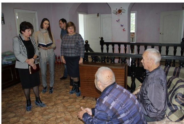
Проверка частного пансионата "Забота" в г. Кемерово, 2019 г.

В 2019 году впервые в связи с опубликованными в сети интернет сведениями о нарушении прав пожилых граждан в частных пансионатах, находящихся на территории Кузбасса, уполномоченным было принято решение проводить проверку данных учреждений.