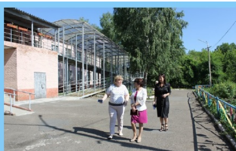
Посещение ГАСУ СО "Кемеровский дом-интернат для престарелых и инвалидов", 2019 г.

В 2019 году проводились проверки ГБСУ СО «Краснинский психоневрологический интернат», ГАСУ СО «Кемеровский дом-интернат для престарелых и инвалидов», ГБСУ СО «Анжеро-Судженский психоневрологический интернат», ГБСУ СО «Анжеро-Судженский дом-интернат для престарелых и инвалидов», ГБСУ СО «Кедровский психоневрологический интернат», ГБСУ СО «Юргинский