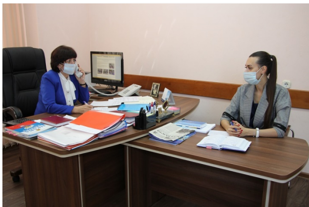
Прямая линия кузбасского уполномоченного, 2019 г.

С марта 2020 года деятельность уполномоченного Кузбасса и аппарата была полностью перестроена в соответствии с режимом «Повышенная готовность». Несмотря на то, что личные приемы и выезды были приостановлены, прием обращений