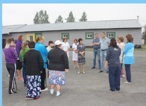
Посещение ГБСУ СО "Кедровский ПНИ", 2019 г.