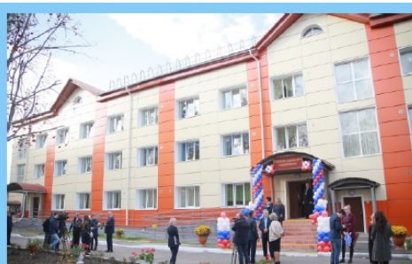
Посещение ГБСУ СО "Юргинский ПНИ", 2019 г.