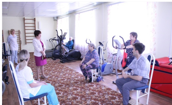
Посещение ГАСУ "Кемеровский дом-интернат для престарелых и инвалидов", 2019 г.

Как показали результаты посещения, проживающие находятся под постоянным наблюдением медицинского персонала. Все необходимые обследования и консультации проводятся на базе медицинских учреждений. Имеются необходимые для оказания первой медицинской помощи оборудование, инвентарь и медикаменты. При разговоре с получателями социальных услуг чувствуется не озлобленное состояние и доброжелательное отношение персонала.