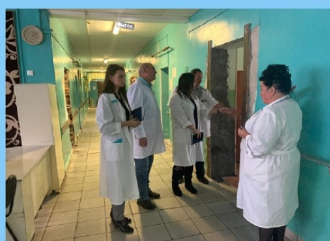
Посещение ГБСУ СО "Тайгинский ПНИ", 2019 г.